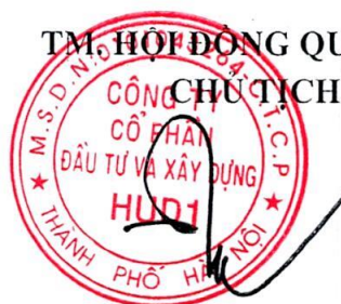
Dương Tất Khiêm